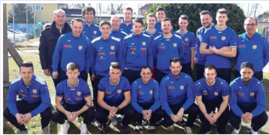
Beim Trainingslager im JUFA Fürstenfeld wurde neben den täglichen Trainingseinheiten auch dem Teambuilding ein großes Augenmerk geschenkt.