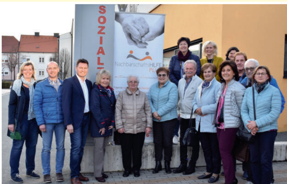
Reges Interesse zeigte sich bei der Bürgerinformationsveranstaltung Nachbarschaftshilfe Plus am 9. März 2019 im Mehrzwecksaal.