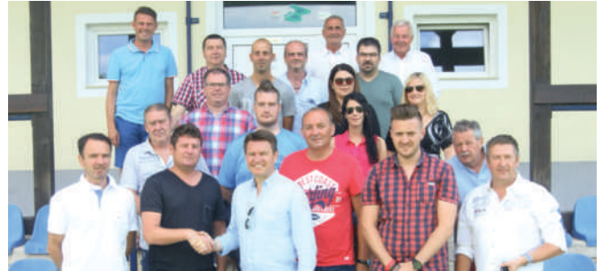
Die SPÖ stimmte alleine für die Förderungen der Neutaler Vereine in der Höhe von insgesamt 37.000,- Euro.