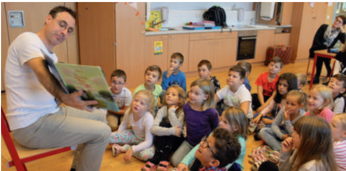
Die SPÖ übernimmt alleine die Verantwortung beispielsweise auch für die Abgangsdeckung im Kinderbetreuungszenrum (218.000,- Euro) und für die Abgangsdeckung in der schulischen Tagesbetreuung (39.000,- Euro).