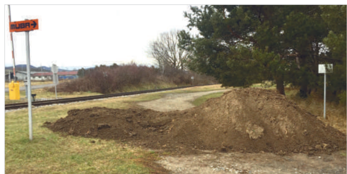
Bild rechts: Nachdem die Bürger trotzdem zum Friedhof zugefahren sind, wurde eine nochmalige Ablagerung vorgenommen.