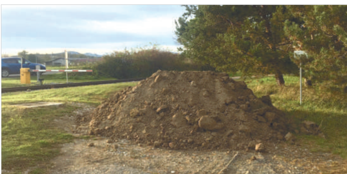
Bild links: Die Erdablagerung am 25. Oktober 2017 (lt. Rechtsanwalt Draisinentour „irrtümlich“).

... Hiezu habe ich mitzuteilen, dass dieser Erdhaufen irrtümlich dort abgeladen wurde.