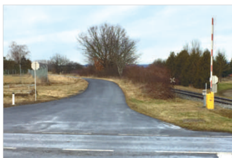
Bild links: Die Gemeindevertretung versucht auch die Betriebszufahrt zur Firma Zeibich und zum Aussiedlerhof sicher zu stellen.