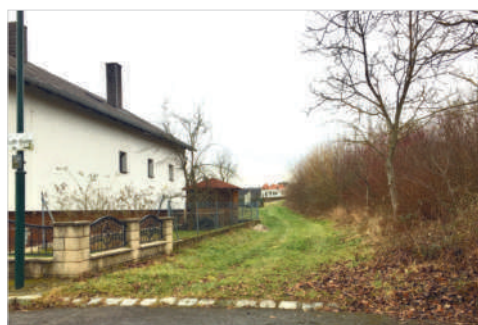
Bild rechts: Große Teile der Breitholzgasse will die Gemeindevertretung eigentumsrechtlich von der Railtour GmbH erwerben.