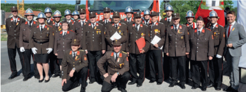
Die SPÖ stimmte alleine für das Rekordbudget mit 50.900,- Euro für unsere Feuerwehr.