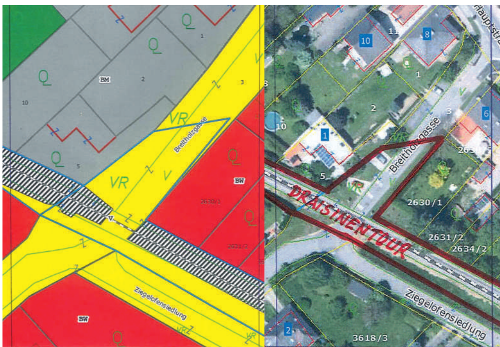
Verkehrsflächenwidmung (V = gelbe Flächen) im Bereich Breiholzgasse

"Was kommt nach der Friedhofzufahrt als nächstes? Wird etwa die Breiholzgasse blockiert? Das können wir nicht zulassen!" Die besorgte Gemeindevorständin Conny Grill