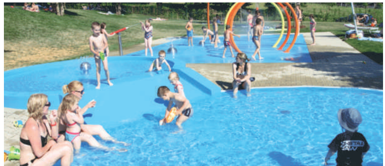
Die SPÖ übernimmt auch alleine die Verantwortung für das Freizeitangebot und somit auch für die Abgangsdeckung im Waldbad (rd. 36.000,- Euro).

"Wir Neutaler dürfen nicht zulassen, dass wegen parteipolitischen Interessen der bewährte Neutaler Weg des Miteinanders Schaden erleidet."