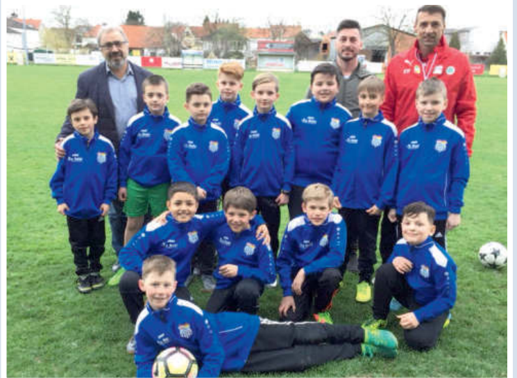
Die U10 wurde vom Restaurant DaBuki und der Fa. MCI mit einer neuen Garnitur Trainingsanzüge ausgestattet. Herzlichen Danke für dies großzügige Geste seitens des Vereins.

Die SpielerInnen des ASKÖ Neutal spielen in der Spielgemeinschaft „SpG MITTE“, welche sich aus den Vereinen aus Neutal, Stoob, Kaisersdorf und Markt St. Martin zusammensetzt.