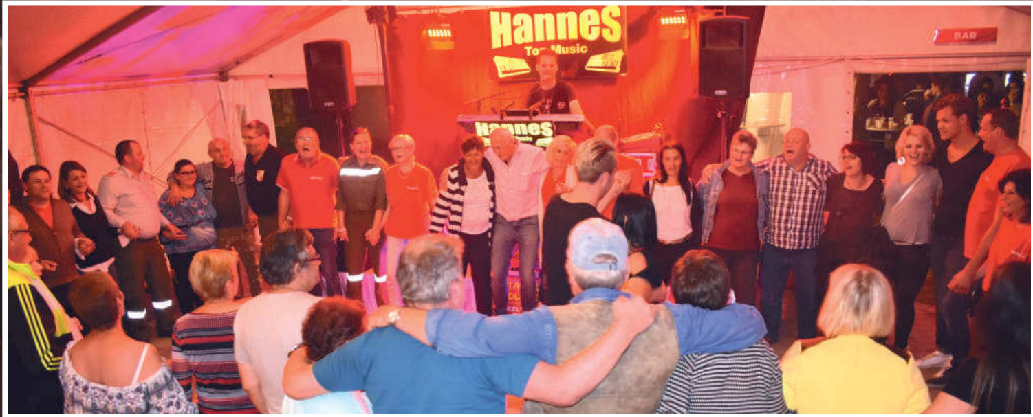
Zum Abschluss eines stimmunsvollen Abends, sangen alle gemeinsam - WAHRE FREUNDSCHAFT. Danke, Ihr wart wieder tolle Gäste!