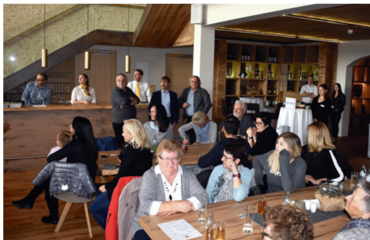
Viele Neutalerinnen und Neutaler überzeugten sich bei der Eröffnung des EventAriums von den optimalen Veranstaltungsbedingungen.

Aktive Wirtschaftspolitik bringt Neutal Jobs und Infrastrukturangebot