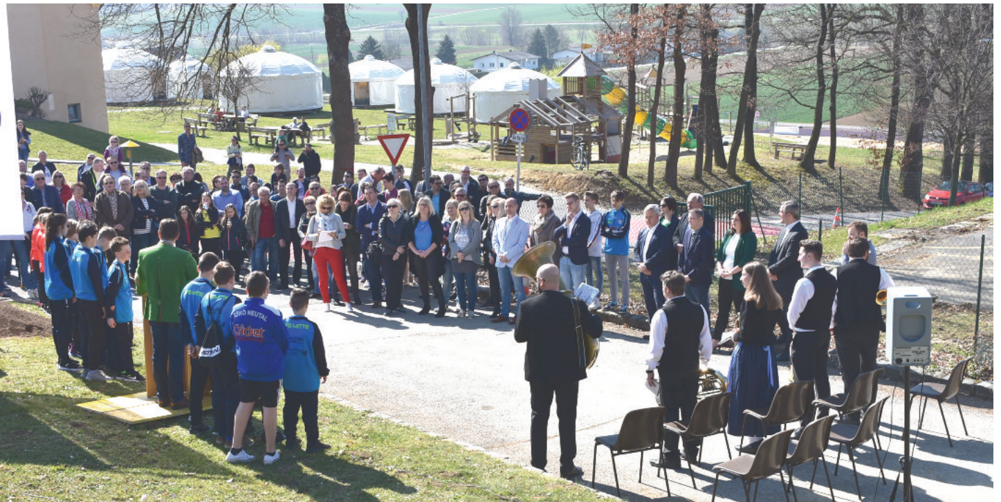
Rund 250 Personen feierten das neue Veranstaltungszentrum, die Sport- und Kulturhalle Neutal, die durch eine besonders gute Akustik und eine umfangreiche Gebäudetechnik besticht.

Am 1. März 2019 erfolgte die einstimmige Beschlussfassung im Gemeinderat zur Errichtung der multifunktionalen Halle, die alle Stüchl'n spielt, mit voraussichtlichen Kosten von 2,48 Mio. Euro. Die zuständige Landesrätin Astrid Eisenkopf bestätigte beim Spatenstich, dass vom Land rund 1 Mio. Euro EU-Fördermittel vorgesehen sind.