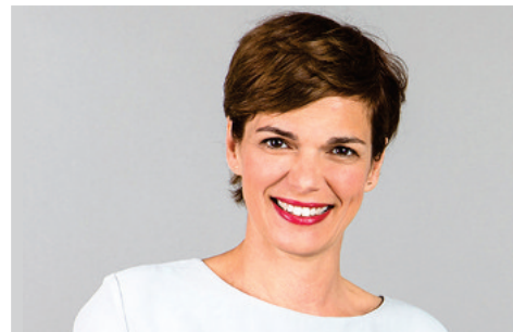
Doz. in Dr. in med. Pamela Rendi-Wagner, MSc

Parteivorsitzende Pamela Rendi Wagner machte angesichts der bevorstehenden EU-Wahl klar, dass die Sozialdemokratie „für ein faires Europa, für faire Steuern und faire Arbeitsbedingungen“, steht. Und dass wir Europa weiterentwickeln müssen, denn es gibt keine Alternative zu einer „friedlichen und sozialen Zukunft auf unserem Kontinent.“ Wir müssen „für mehr Gerechtigkeit und Zusammenhalt eintreten und Europa gegen Nationalisten und Rechtsextremisten schützen - heute mehr denn je, denn Europa ist die Zukunft unserer Kinder!“