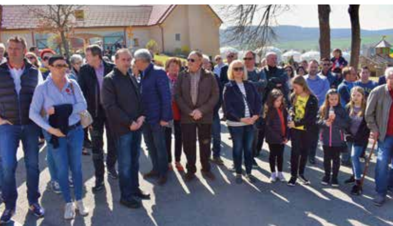
Viele Neutalerinnen und Neutaler sind zum Spatenstich ihrer Sport- und Kulturhalle gekommen.