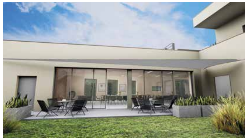
Schaubild Ansicht Innenhof