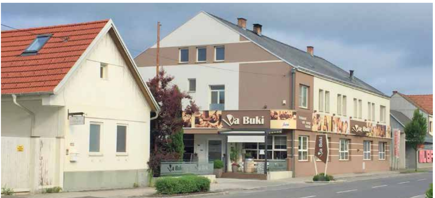
Die Revitalisierung des Ortskerns stellt für alle Gemeinden – so auch für Neutal – eine große Herausforderung dar.

und Touristen bereitstellen zu können. Um die beengte Parkplatzsituation in diesem Ortszentrumsbereich zu lösen, wurde für das befestigte Grundstück neben dem Gemeindeamt vom Gemeinderat eine entgeltliche Nutzungsvereinbarung mit teD abgeschlossen.