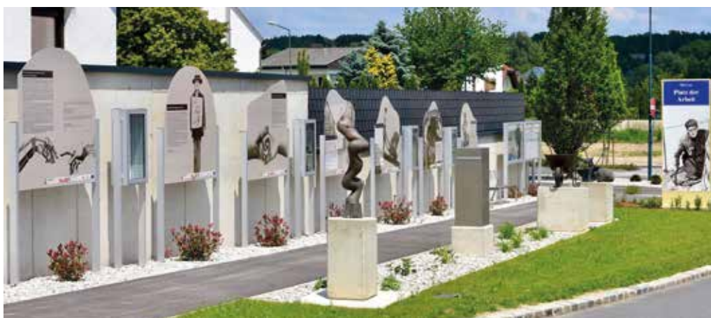
Die schöne Gestaltung des Auszuges unserer Geschichte am Platz der Arbeit ist ein wichtiger Beitrag der kulturellen Dorferneuerung.