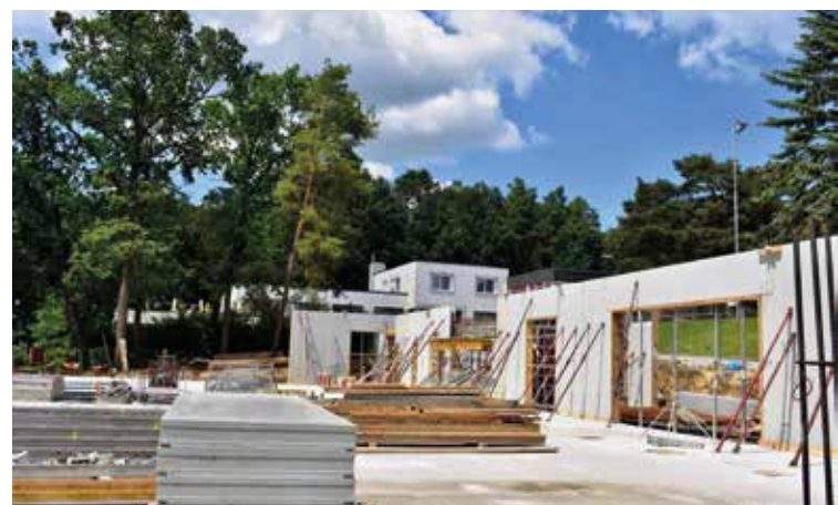
Sport- und Kulturhalle Baufortschritt 1.6.2019; Baufertigstellung ist Ende 2019 geplant.

Mit Unterstützung von Bund, Land und Europäischer Union