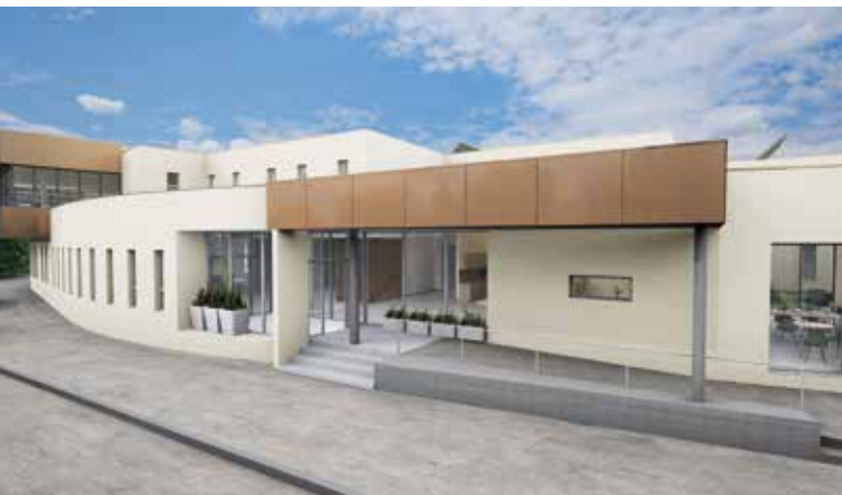
Schaubild Ansicht Kerystraße

werden. Somit werden Kosten nicht bei der Pflege, sondern im hauswirtschaftlichen Sinn gespart. Insgesamt 31 Bewohnerinnen und Bewohner werden sich ab dem Jahr 2021 in liebevoll gestalteten Einzelwohneinheiten wohlfühlen. Die Einzelzimmer mit Badezimmer werden rund 30 m 2 groß, weiters wird es ein größeres Zimmer für ein Ehepaar geben.