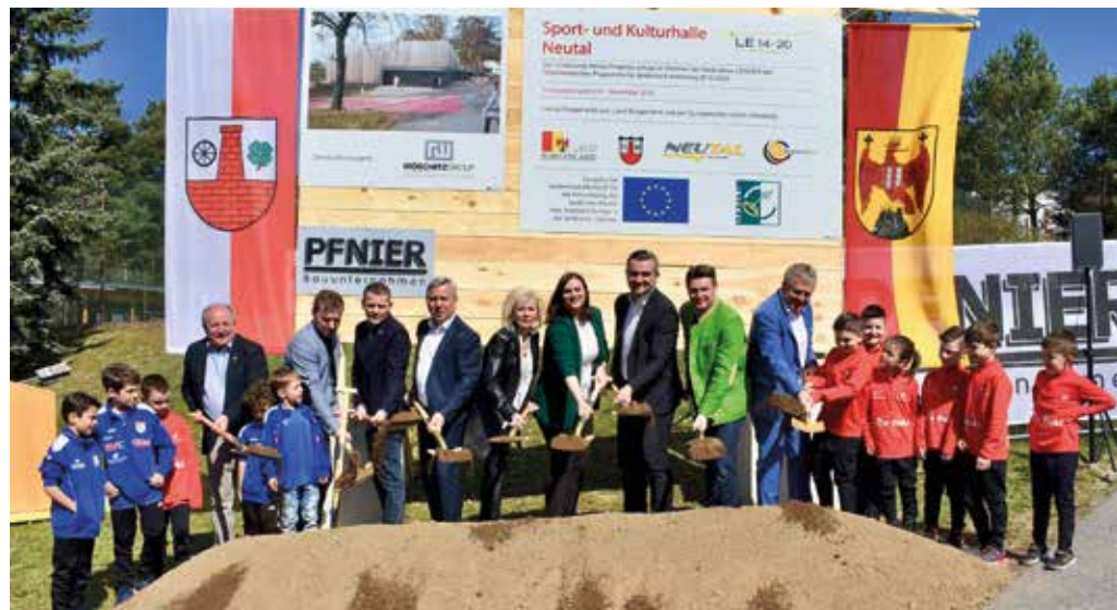
Unsere sportbegeisterten Kinder freuen sich schon auf die Sport- und Kulturhalle und halfen den Ehrengästen beim Spatenstich.

freuen, wenn bereits im Gemeindegedenkjahr 2020 auf der Bühne ein umfassendes Kulturprogramm für alle Generationen veranstaltet werden kann.